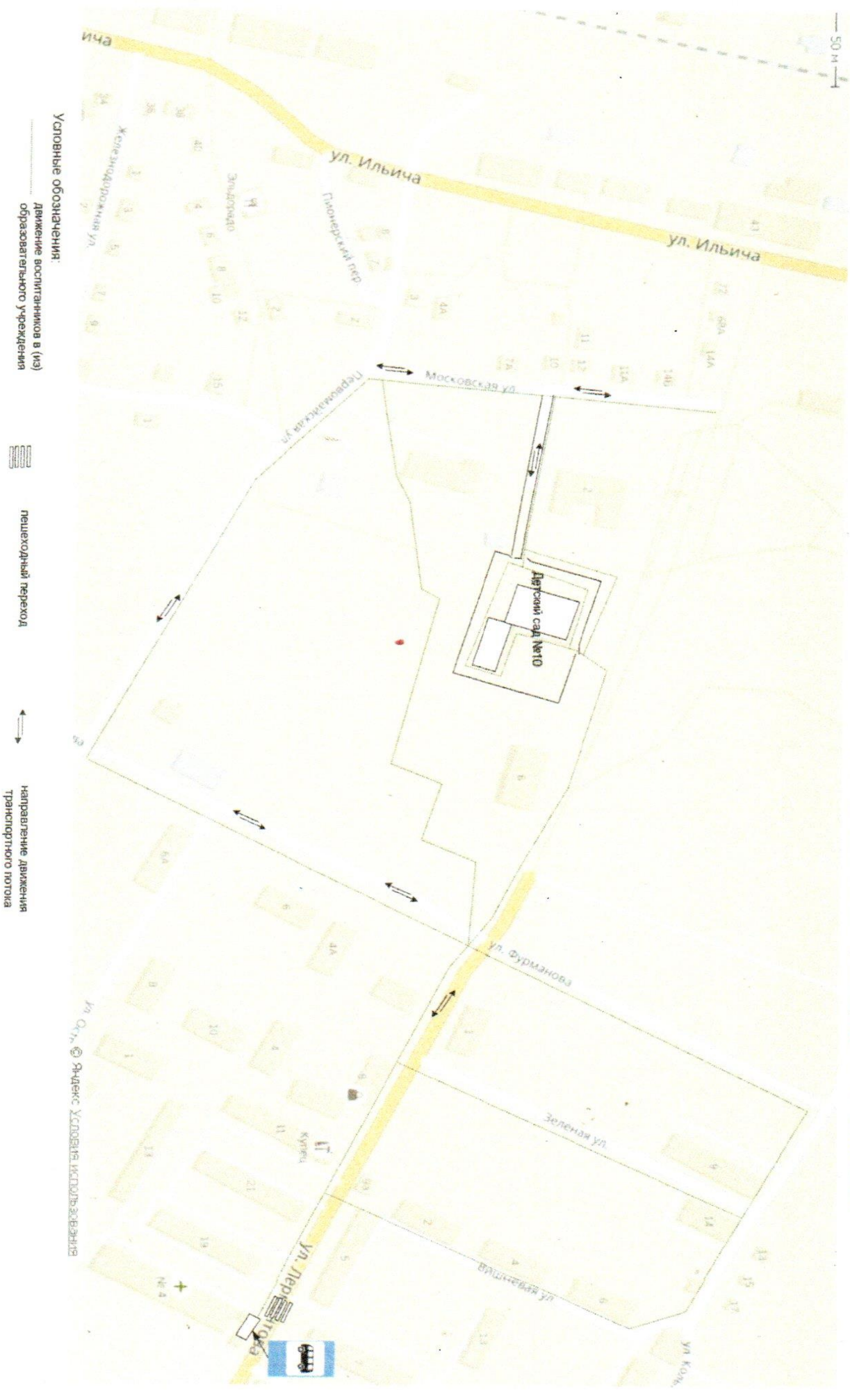
План-схема района расположения МДОУ "Ряжский детский сад №10", пути движения транспортных средств и воспитанников